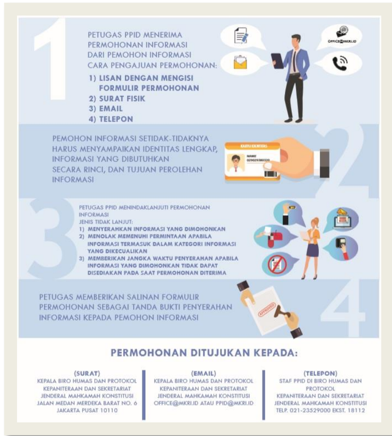
Pengumuman Prosedur Permohonan Informasi di Laman MKRI

Dalam hal Pemohon Informasi adalah seorang yang buta huruf, lansia atau berkebutuhan khusus lainnya, petugas layanan informasi membantu Pemohon Informasi memenuhi prosedur permohonan dengan menuliskan permohonan Pemohon Informasi ke dalam formulir permohonan informasi.