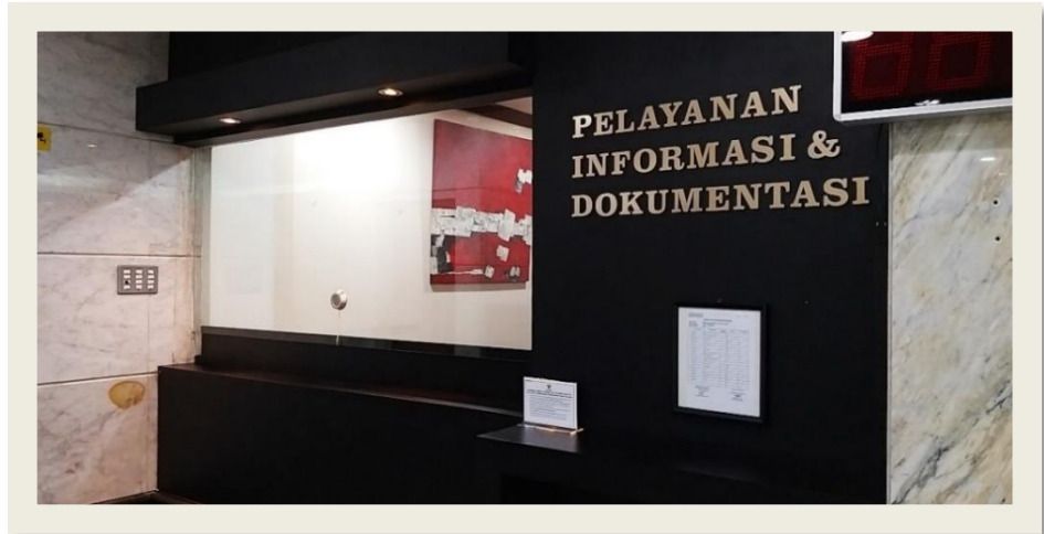
Ruang Pelayanan Informasi dan Dokumentasi Mahkamah Konstitusi

Pengajuan Permohonan Informasi tidak dikenakan biaya.