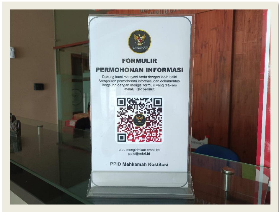
Penyediaan QR Formulir Permohonan Informasi Mahkamah Konstitusi